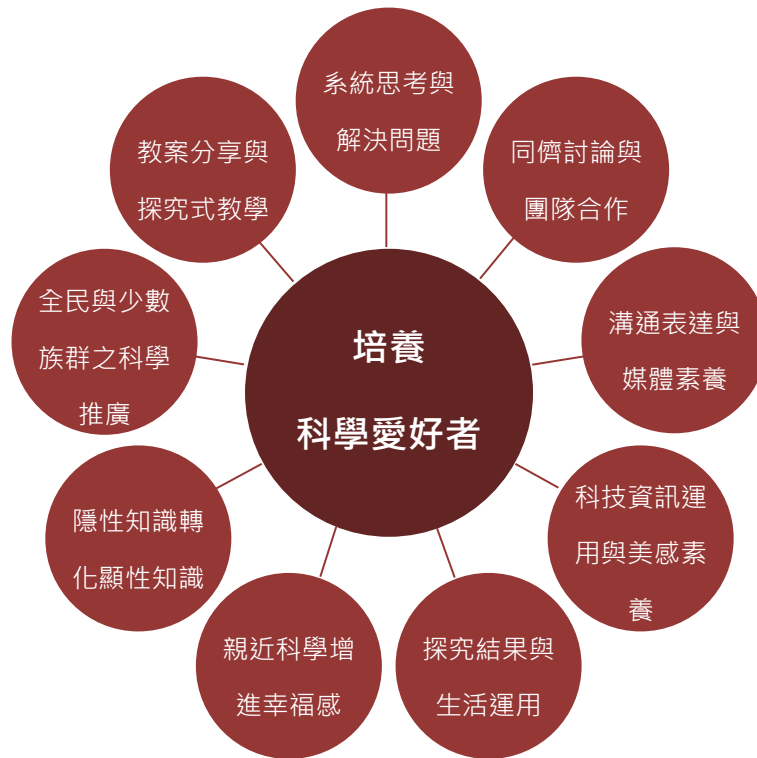
圖 1、全國科學探究競賽核心價值