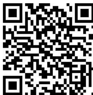
客家歌謠合唱曲譜選集 II 下載網址